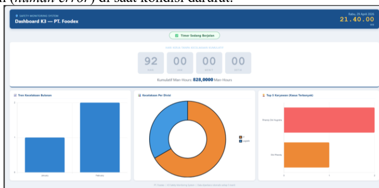
Gambar 3. Tampilan Halaman Monitoring Publik ( Kiosk Mode )

Untuk kegiatan operasional pendataan, modul Pelaporan Kecelakaan mendigitalisasi proses pencatatan insiden Lost Time Injury (LTI). Formulir ini terintegrasi dengan fitur Auto-Fill berbasis AJAX yang secara asinkron menarik data karyawan (Nama dan Divisi) hanya dengan memasukkan Nomor Induk Karyawan (NIK). Otomatisasi ini terbukti krusial untuk mencegah galat pengetikan ( human error ) di saat kondisi darurat.