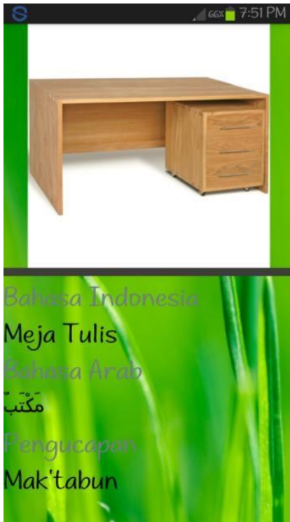
Gambar 4. Tampilan Pencarian kata Indonesia-Arab