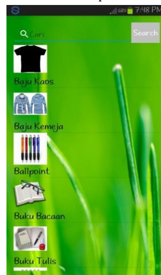
Gambar 3. Tampilan Kosakata Indonesia-Arab