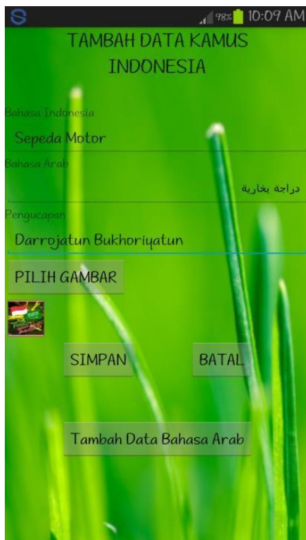
Gambar 5. Tampilan Kosakata Arab-Indonesia