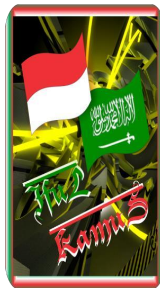
Gambar 2. Tampilan Awal

Hal penting yang menjadi perhatian pada perancangan adalah bahwa rancangan yang dibuat diharapkan dapat digunakan dengan mudah oleh semua pengguna smartphone android. Selain itu beberapa hal yang harus diperhatikan antara lain adalah kinerja program yang baik dalam mengoperasikan aplikasi yang dibuat. Berikut adalah beberapa rancangan antar muka aplikasi kamus bahasa Arab-Indonesia dan Indonesia-Arab berbasis Android :