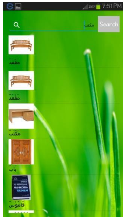
Gambar 6. Tampilan Tambah Data