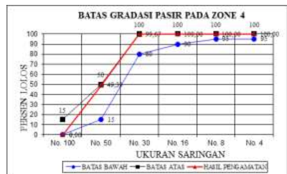
Gambar 3. Batas gradasi pasir besi

Berdasarkan spesifikasi, maka hasil pemeriksaan analisa saringan Bahan Tambah (Pasir Besi) Kelurahan Laompo masuk dalam daerah Gradasi 4 atau Pasir Halus.