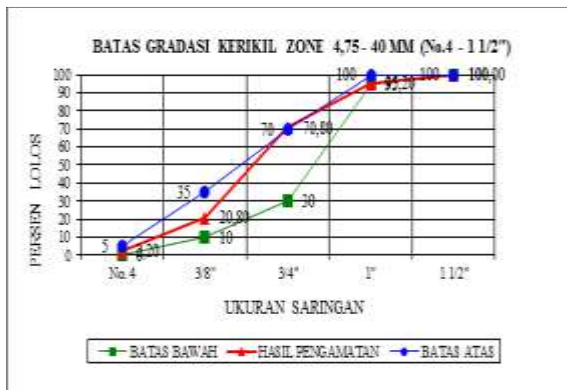
Gambar 2. Batas gradasi kerikil

Berdasarkan spesifikasi diatas, maka hasil pemeriksaan analisa saringan Agregat Kasar (Batu Alam) Kelurahan Laompo masuk dalam daerah Gradasi Standar Agregat dengan butiran maksimum 40 mm.