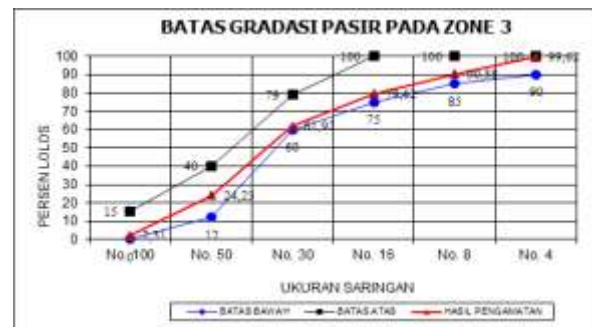
Gambar 1. Batas gradasi pasir

Berdasarkan spesifikasi diatas, maka hasil pemeriksaan analisa saringan Agregat Halus (Pasir laut) Kelurahan Laompo masuk dalam daerah Gradasi III atau Pasir agak halus.